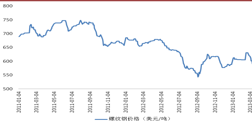
图 2: 原材料螺纹钢中国市场价格近年来大幅下滑