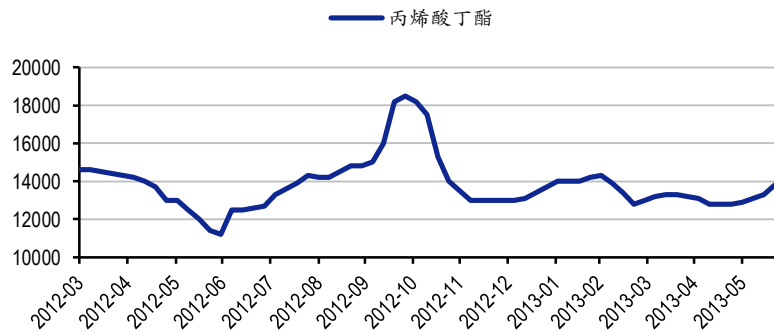
图 2: 丙烯酸丁酯华东市场价格 元/吨