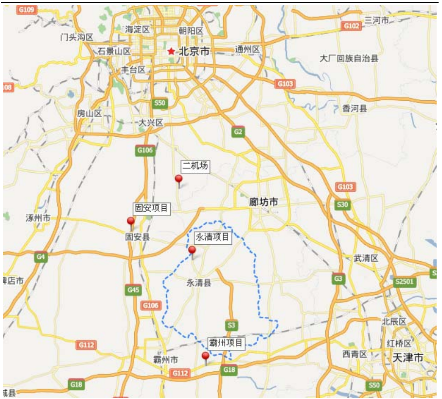
图表 2. 华夏幸福永清项目地理位置