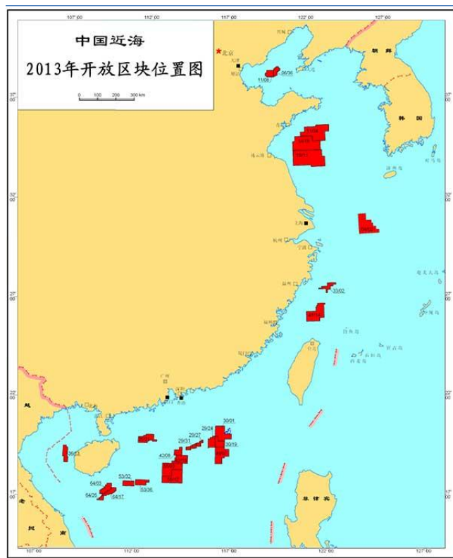
图 1：中国近海 2013 年 25 个油气区块招标。

随着中海油新增海上区块招标合作开采的开始，其后续海上平台设备需求将会持续增加，这无疑对于具备较好技术优势以及资源渠道优势的东方电热带带来巨大机会。我们研判公司不仅在海外油气平台项目上赢得较大市场，而且在国内海上油气开采中将获益。