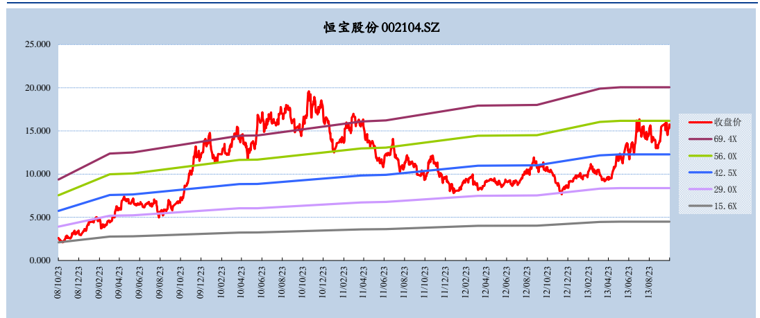
图 3：公司的 PE-Band