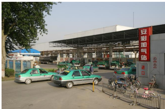
图 2：CNG 加气站