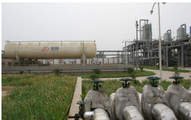
图 1：公司现有 LNG 液化工厂

另外一方面，随着公司 LNG 站点建设的加强，公司 LNG 直销比例不断增加，这将拉升公司售价约 20%（相对于批发价），极大增厚公司 LNG 业务的盈利能力。同时，公司发展战略明确提出：在天然气领域，公司以 LNG 液化工厂为依托，积极推动 LNG 零售站点布点工作，LNG 零售将成为公司燃气业务新的利润增长点。