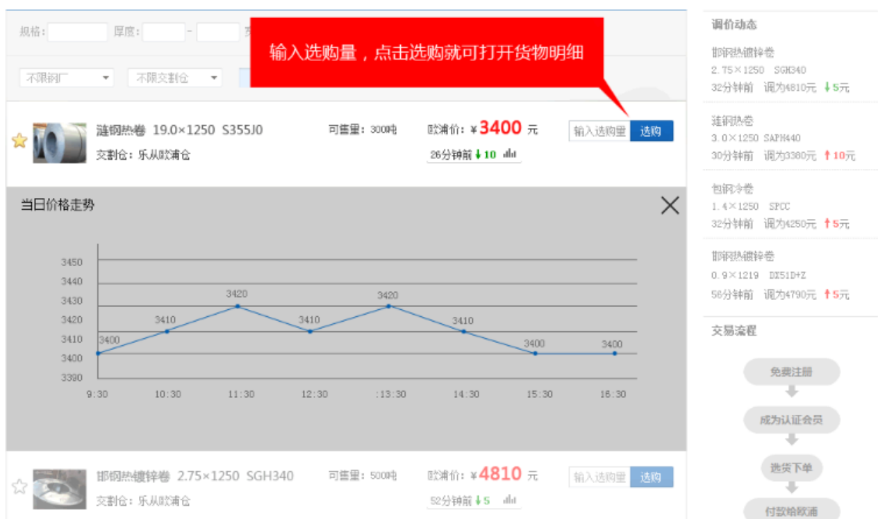
图 2 欧浦商城采购演示—日内价格走势