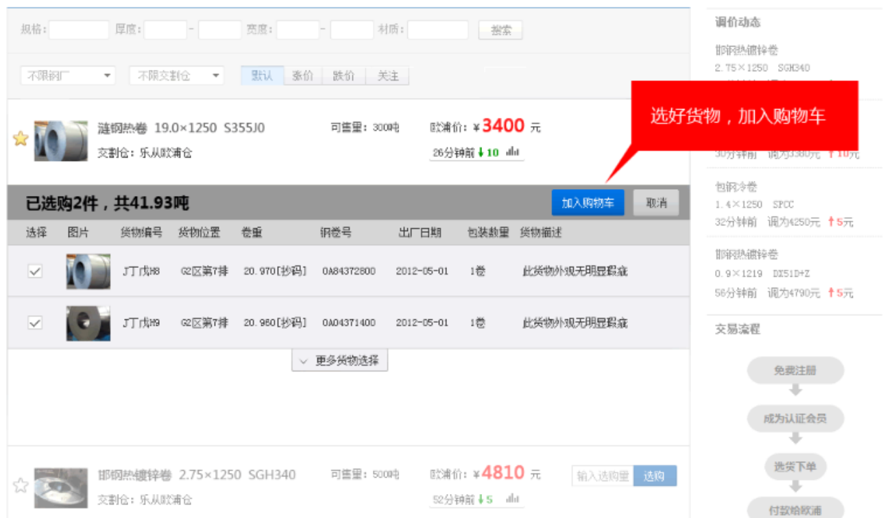
图 3 欧浦商城采购演示—货物明细