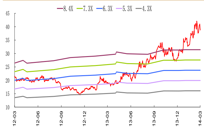
图 2：PB-Band 分布