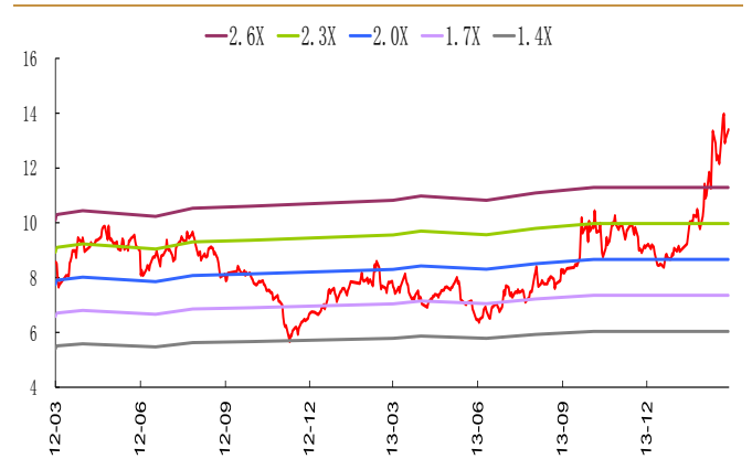
图 2：PB-Band 分布