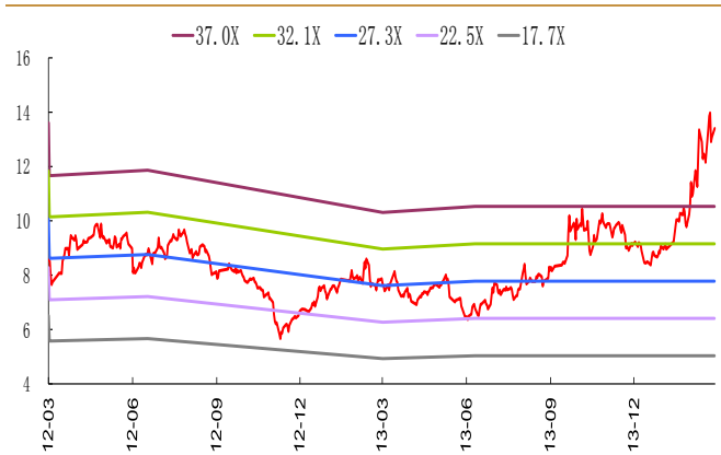
图 1：公司 PE-Band 分布