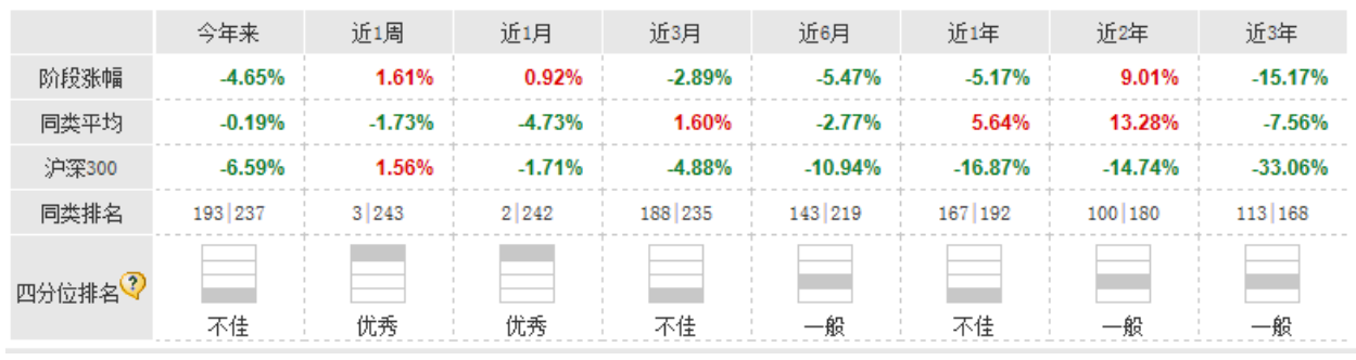
图 2 华泰柏瑞积极成长在各阶段的业绩表现情况

数据来源: Choice 资讯、天天基金研究中心 截止日期: 2014-3-24