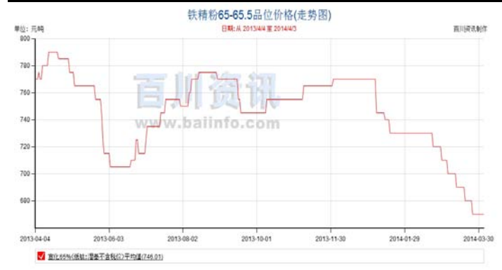
图 1:2013 年国产铁精粉价格走势