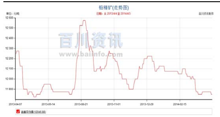
图 3:2013 年铅精粉价格走势