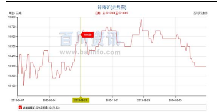
图 4:2013 年锌精粉价格走势