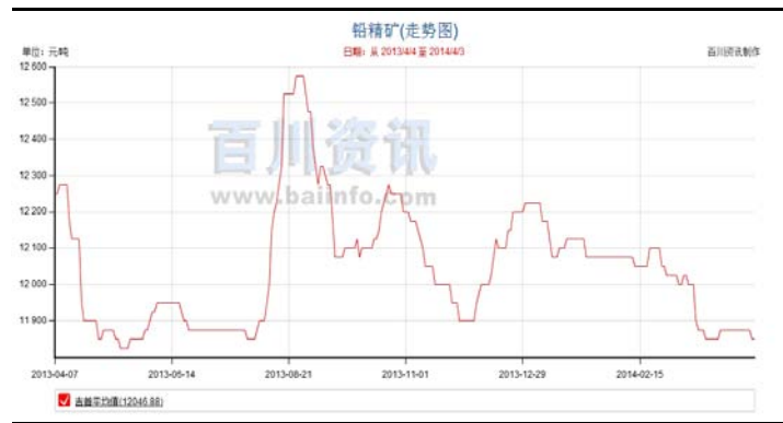
图 3: 2013-2014 年一季度铅精粉价格走势