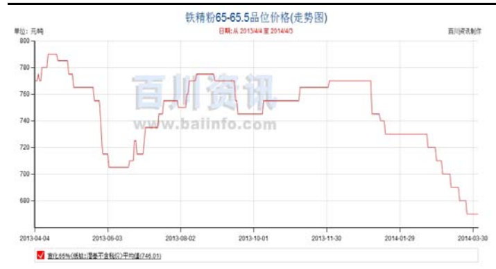
图 1:2013-2014 年一季度国产铁精粉价格走势