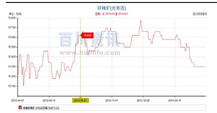
图 4: 2013-2014 年一季度锌精粉价格走势