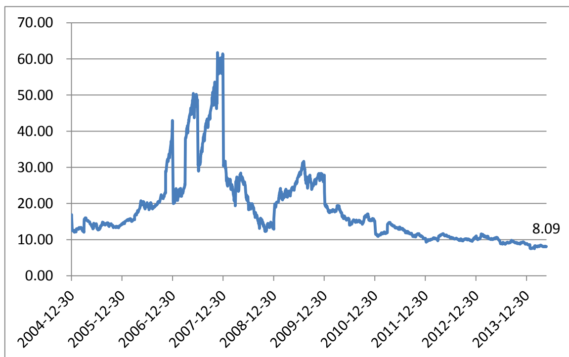
图1： 沪深 300 指数自基日以来的市盈率（TTM）变化