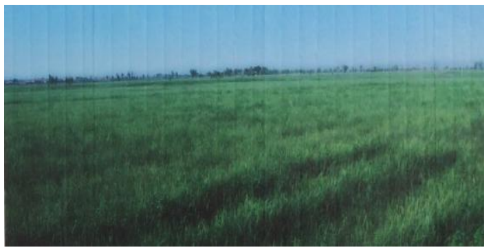
图 3: 大青山万亩草场修复后(2013.7)