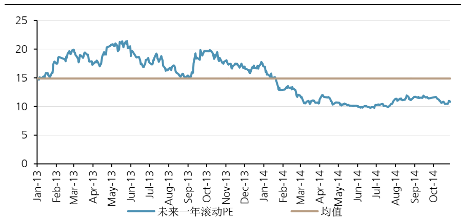
图表 3: 公司未来一年滚动 PE