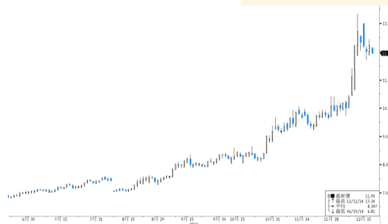
白雲機場 參考數據