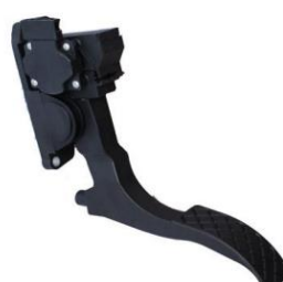
轿车用电子油门踏板