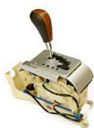
轿车用变速操纵器