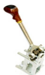
客车用变速操纵器