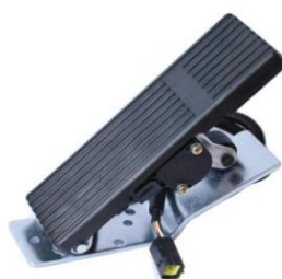
客车用电子油门踏板