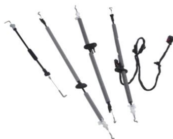
内外开拉门拉索等