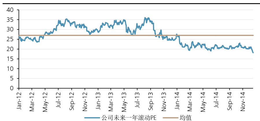
图表 2: 公司未来一年滚动 PE

来源: Bloomberg, 上海家化为瑞银证券估算, 其余为一致预期; 股价截至 2014 年 12 月 23 日