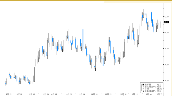
恒瑞醫藥 參考數據