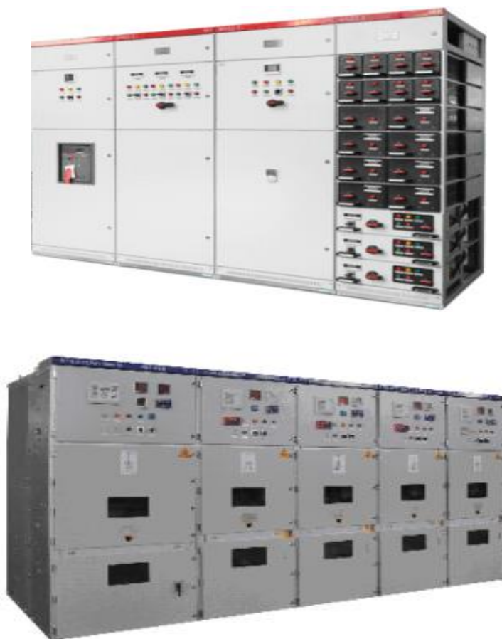
图 2 公司部分产品示意图