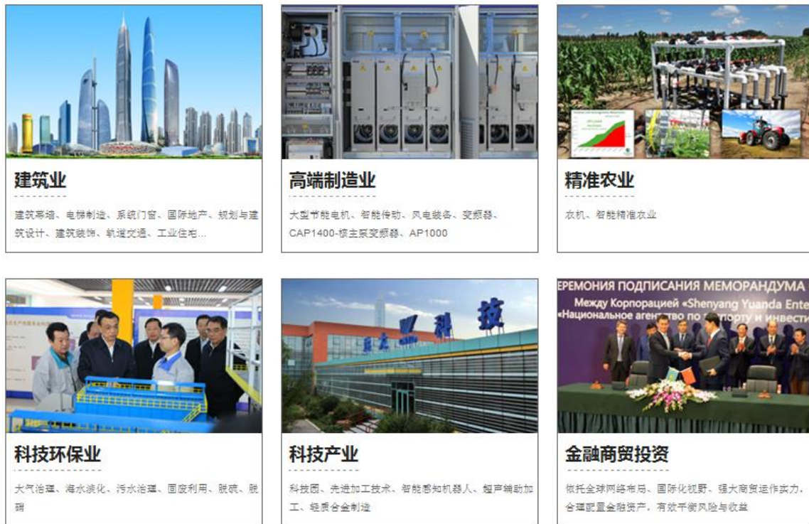
图 5：沈阳远大企业集团 6 大业务板块

在远大集团的业务板块中，我们认为其 AP1000/CAP1400 核主泵变频器（核电设备）、精准农业、智能滴灌技术具有较好的市场前景。