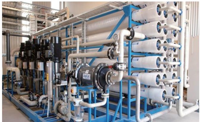
图 4：沈阳远大企业集团环保业务