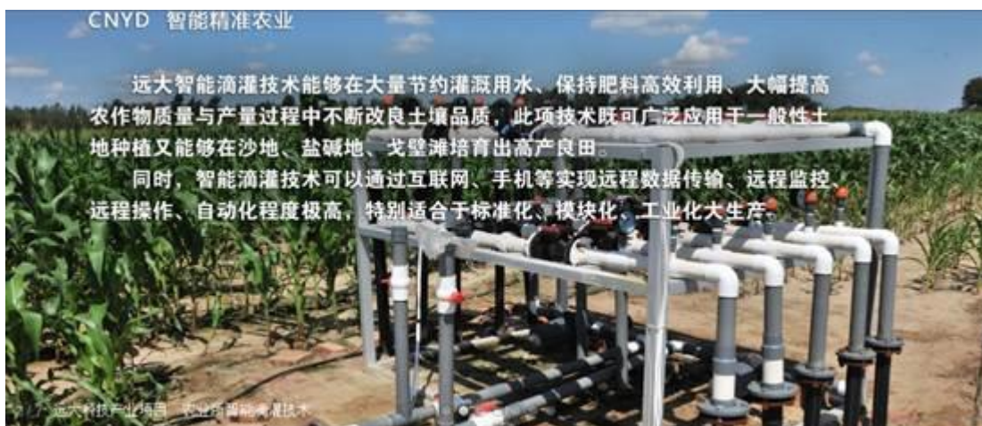
图 7：沈阳远大企业集团：精准农业、智能滴灌技术

远大智能滴灌技术能够在大量节约灌溉用水、保持肥料高效利用、大幅提高农作物质量与产量过程中不断改良土壤品质，此项技术既可广泛应用于一般性土地种植又能够在沙地、盐碱地、戈壁滩培育出高产良田。同时，智能滴灌技术可以通过互联网、手机等实现远程数据传输、远程监控、远程操作、自动化程度极高，特别适合于标准化、模块化、工业化大生产。此项技术能够在稳定、提高粮食产量的同时，恢复地下水，为重金属污染和垃圾围田赢得治理时间。创新智能滴灌技术不仅是治理土地荒漠化最有效的方法，更是推动全球农业生产和生态修复走上良性循环之路的有力保障。