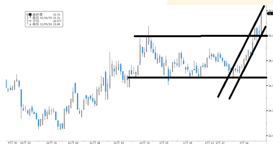
伊利股份 參考數據