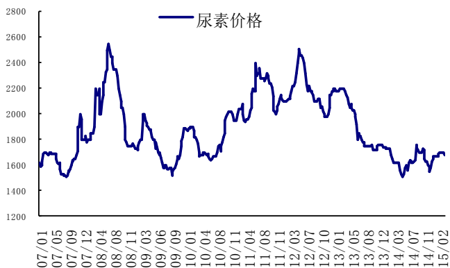
图:1 小颗粒尿素价格走势