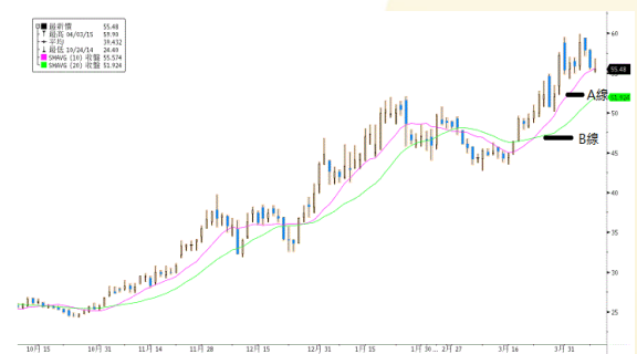
華夏幸福 參考數據