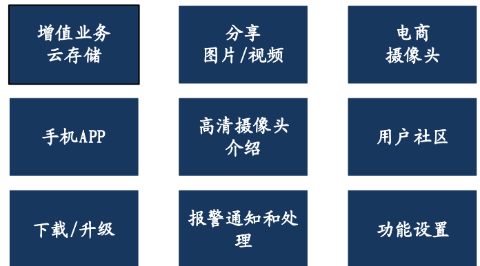
图 3：尚云平台相关功能