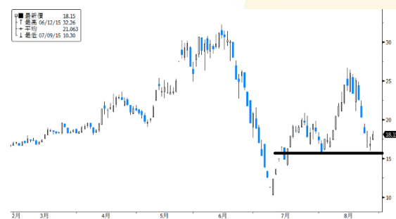
錦江投資 參考數據