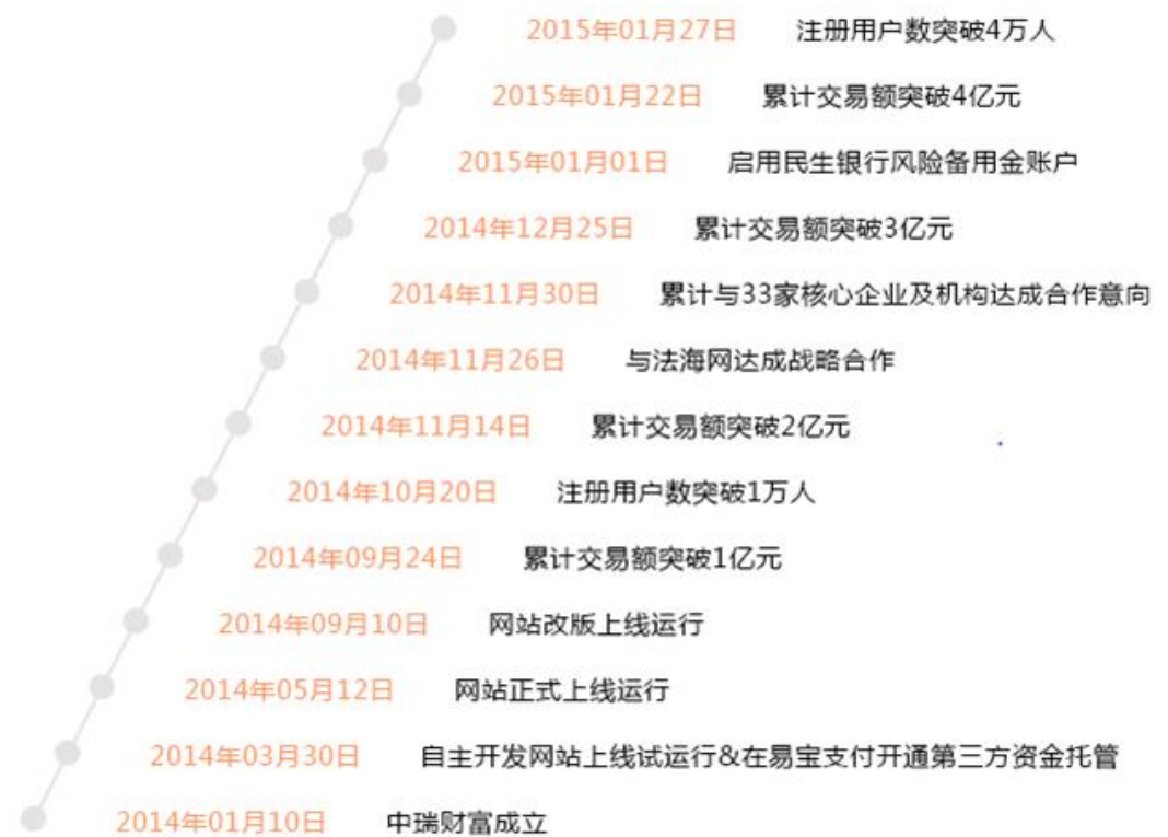
图 8：中瑞财富历史沿革

中瑞财富于 2014 年 5 月 12 日正式上线，是国内首家大宗商品互联网供应链金融信息服务平台，截止 2015 年 9 月 13 日，平台累计成交额突破 21 亿，平台注册用户近 20 万人。