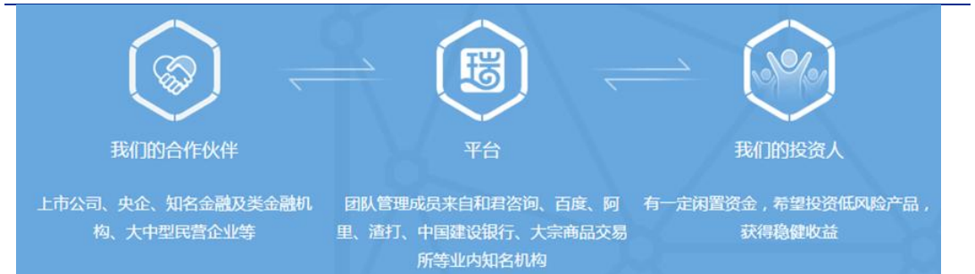
图 7：中瑞财富平台简介