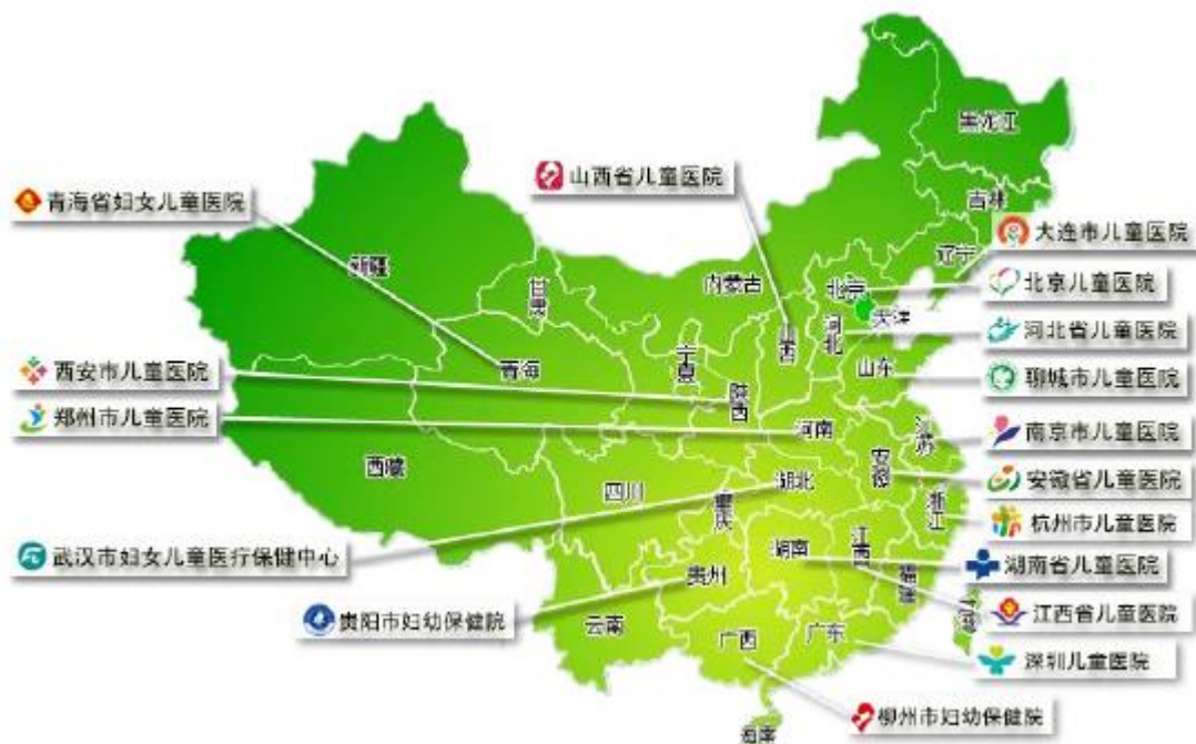
图表：北京儿童医院集团医联体成员