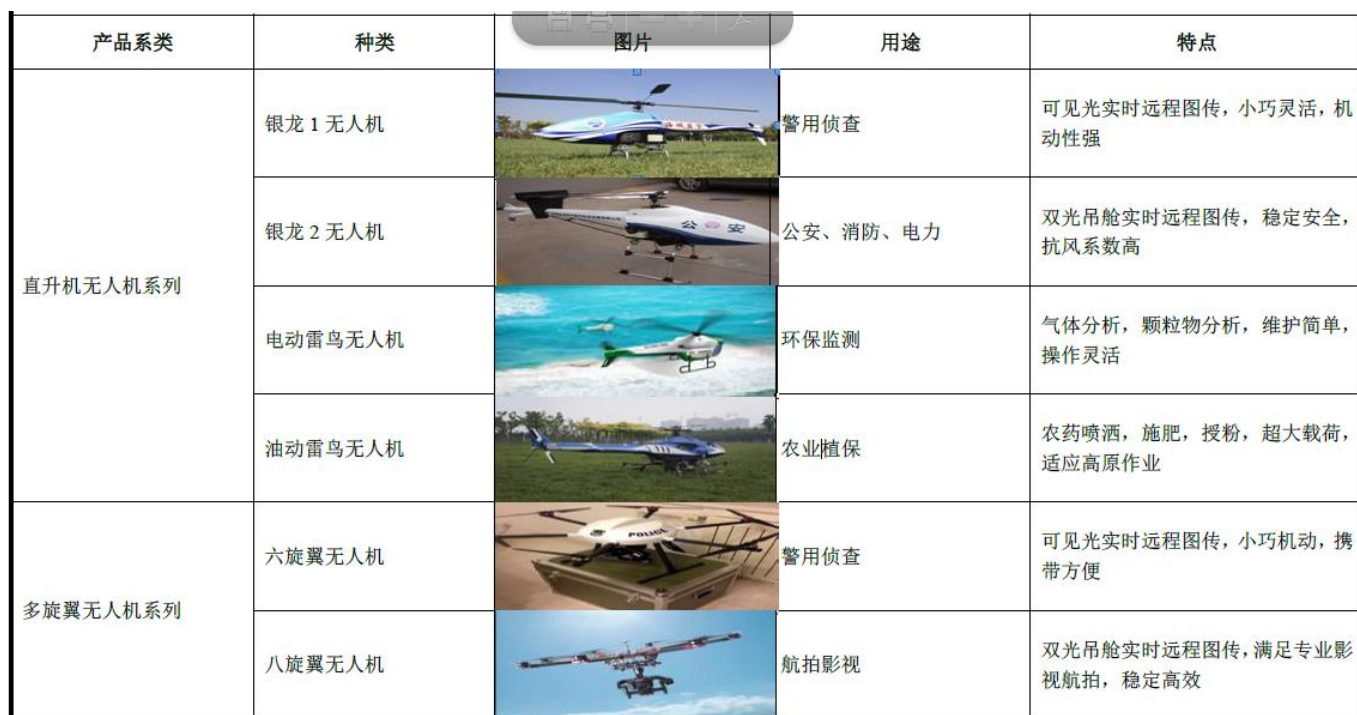
图 4：全华时代主要产品