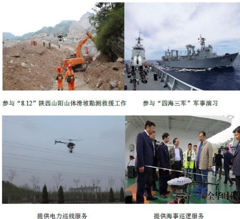
图 3：全华时代部分无人机应用