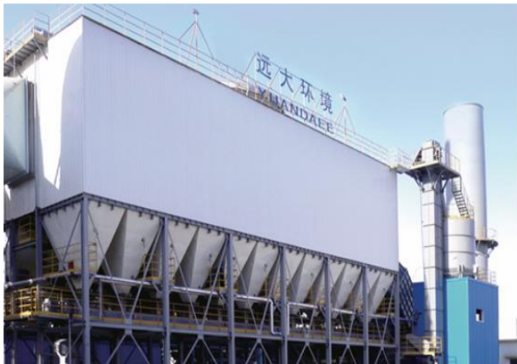
图 3: 沈阳远大企业集团环保业务