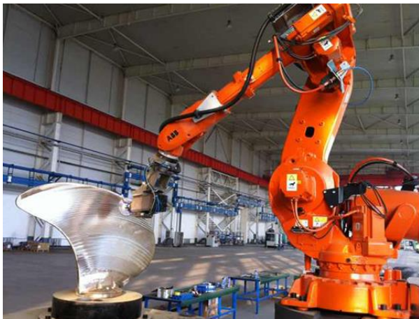
图 1: 沈阳远大企业集团智能磨削机器人