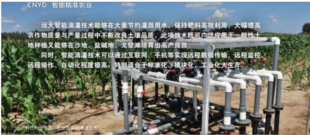
图 7：沈阳远大企业集团：精准农业、智能滴灌技术