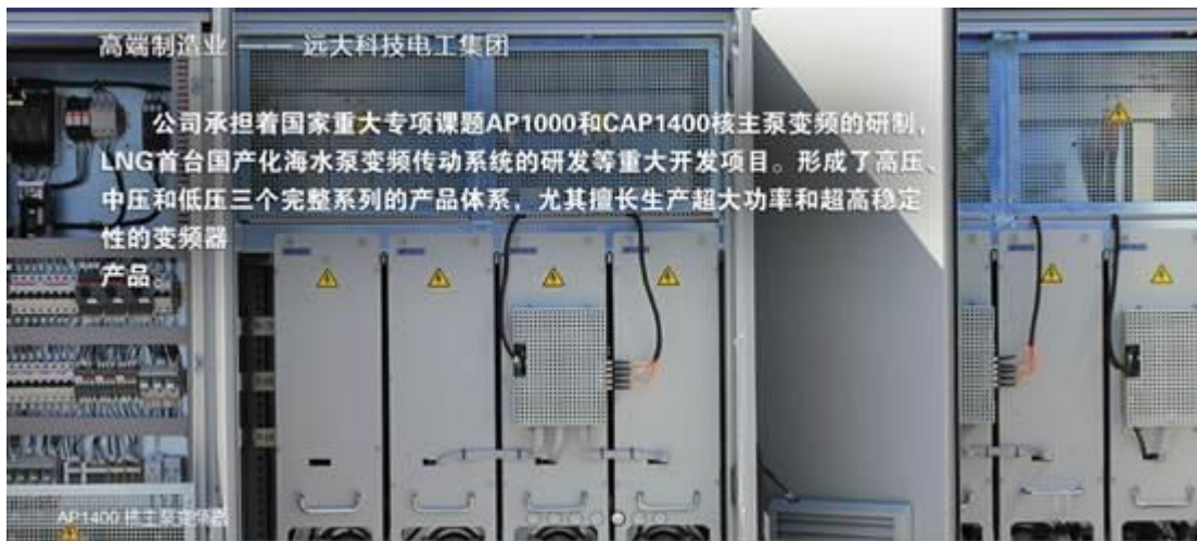
图 6：沈阳远大企业集团：核电关键设备——AP1000/CAP1400 核主泵变频器

目前，该变频器已成功下线。经过核电级标准的检验检测，各项性能指标全面满足三代核电站主泵运行特点和需求。该项目的成功下线标志着我国第三代核电站主泵系统核心部件摆脱依赖进口产品的局面，加快推进了三代先进压水堆核电国产化进程，同时为我国自主知识产权的 CAP1400 核电主泵变频系统鉴定了基础。