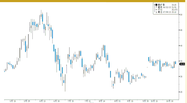
昆藥集團 參考數據