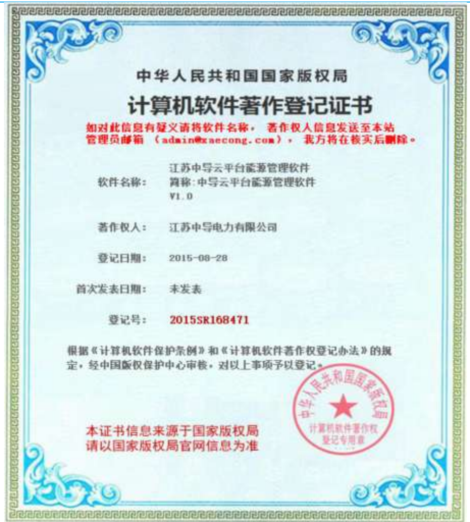
图表 3：江苏中导云平台能源管理软件著作权