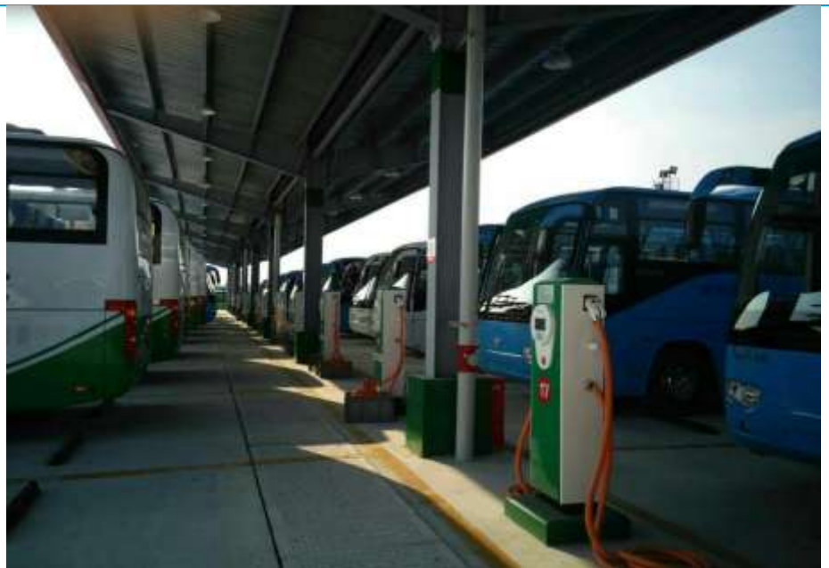
图表 4：苏州金龙电动汽车充电站