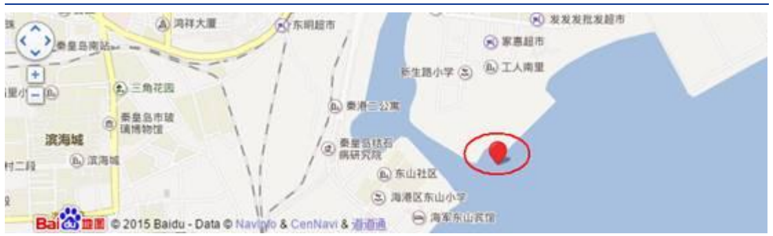
图 2: 秦皇岛地理位置情况

秦皇岛港是目前中国最大的能源输出港, 也是我国主要对外贸易综合性国际港口之一。煤炭输出量约占全国沿海煤炭输出量的 70% 以上, 在我国北煤南运和煤炭外贸出口中具有重要地位。