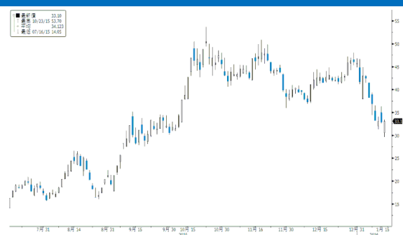
錦江投資 參考數據