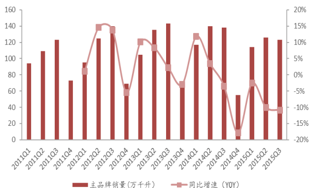
图表 1: 2015 年 Q4 公司啤酒销量下滑 6%