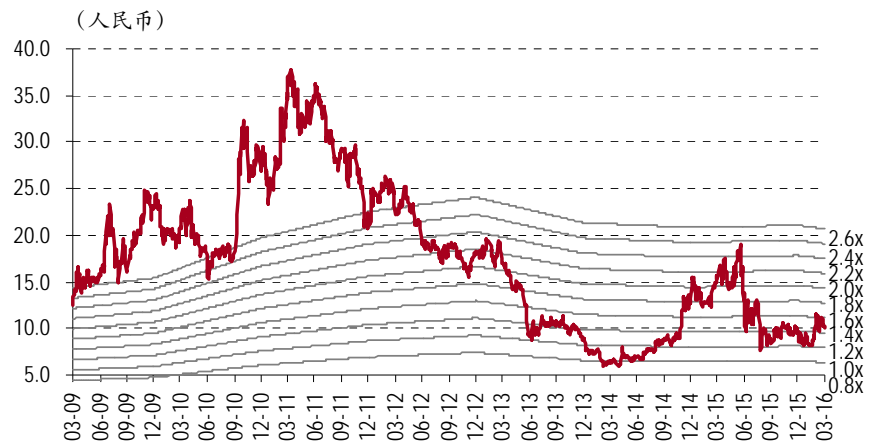
图表 10. 市净率趋势图 (A 股)