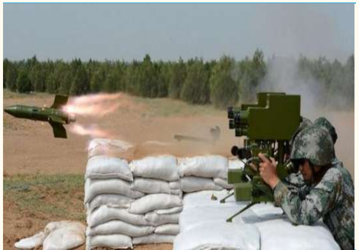
图表 3：师凯科技产品应用场景反坦克导弹示意图