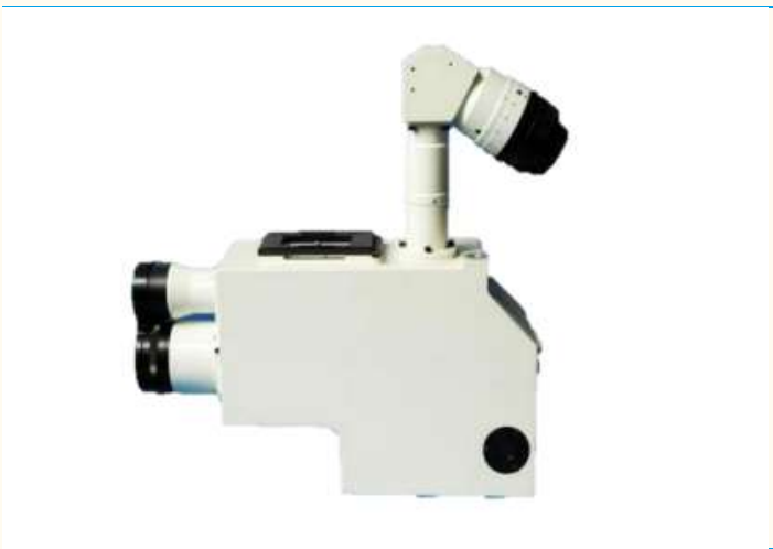
图表 2：师凯科技主要产品外观示意图