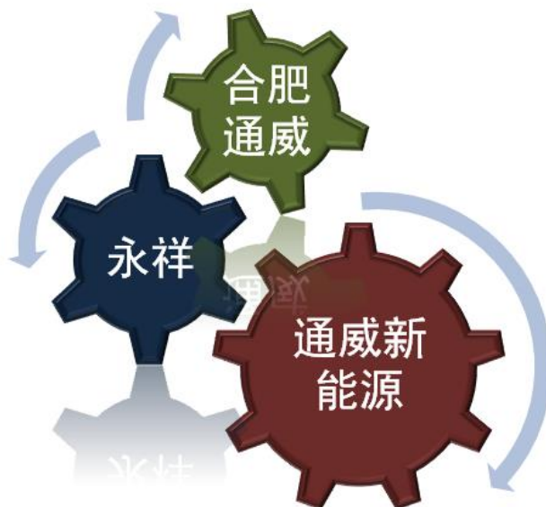
图表 1: 通威光伏战略协同发展布局

在光伏行业支持性政策不断释放和技术进步的背景下, 公司通过收购新能源公司, 有效整合渔业和光伏产业链, 助推公司盈利能力的提高。以重组完成后股本摊薄, 预测公司 2016-2018 年 EPS 分别为 0.28、0.42 和 0.46, 给予“买入”评级。