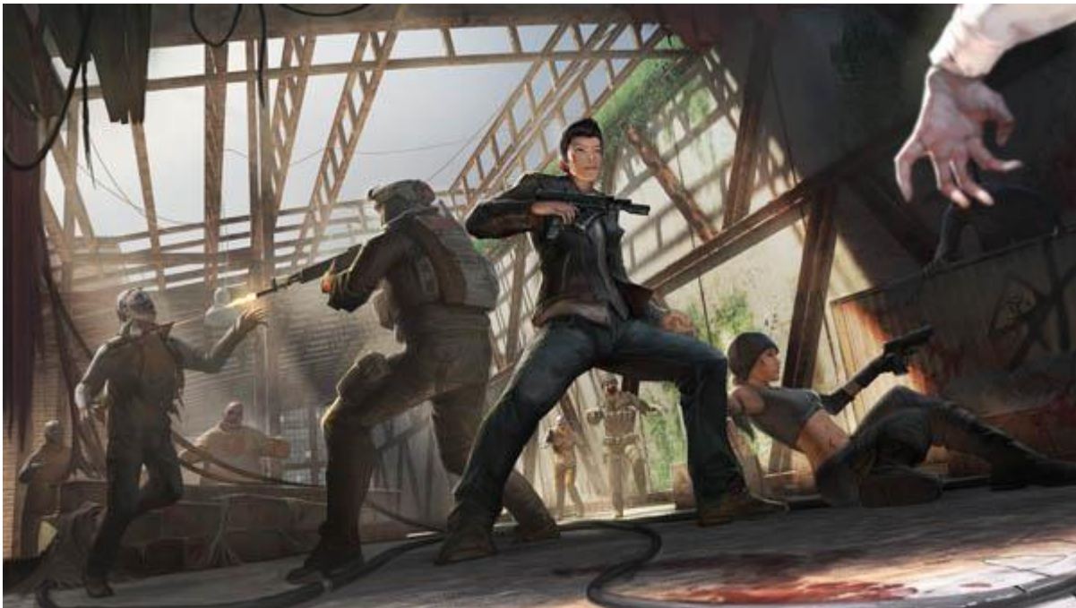
图表 1:《罗布泊丧尸》在 Viveport 上面曾获得付费榜第一名