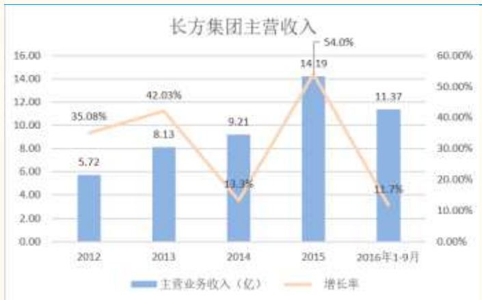
图表 1：长方集团营收