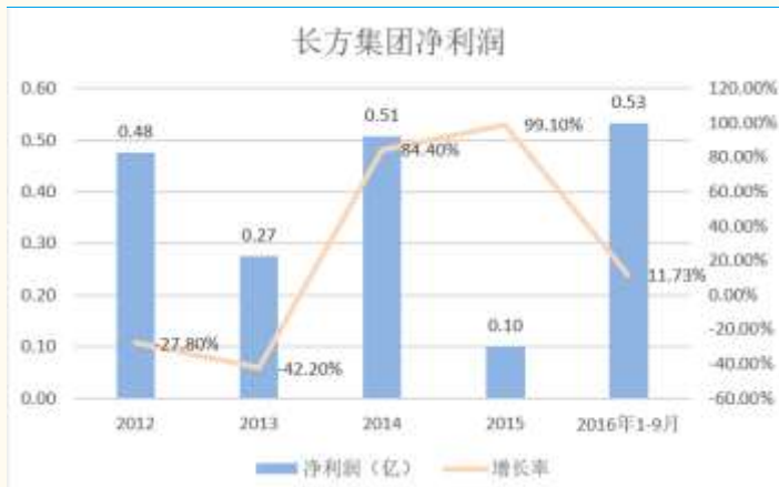
图表 2：长方集团净利