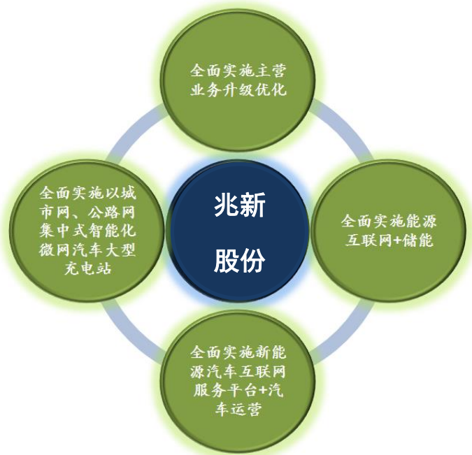
图表 1：兆新股份“四个全面”战略

公司电站拓展不达预期，新能源车和充电站不达预期，储能业务拓展不达预期以及新能源政策有所变化等。