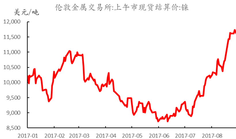
附图 2：伦镍 2017 走势