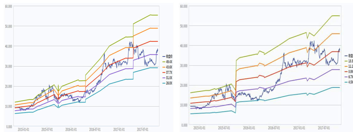
图表 2 三聚环保 PE/PB-Bands