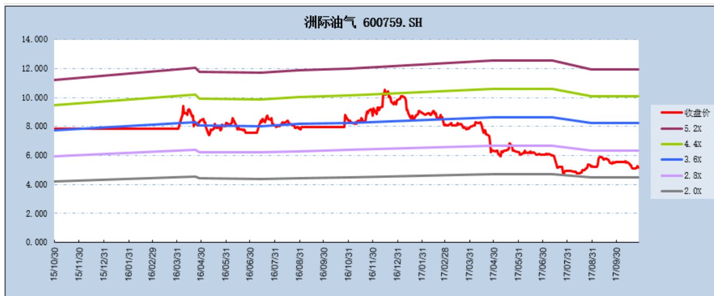
图表2: PB-Band (TTM)