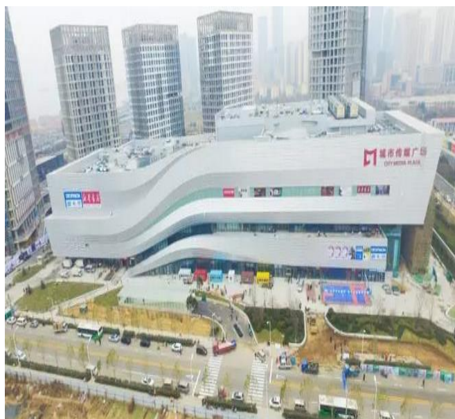
图表 1：城市传媒广场外部