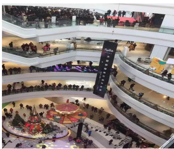
图表 2：城市传媒广场内部