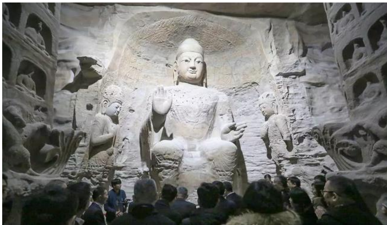
图表 3：广场内以 3D 打印技术等比例复制的云冈石窟艺术馆