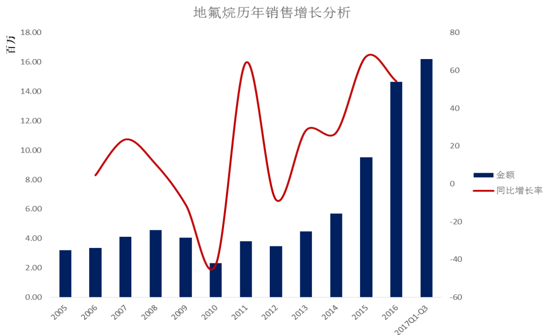
图 1：地氟烷国内样本医院销售及增速