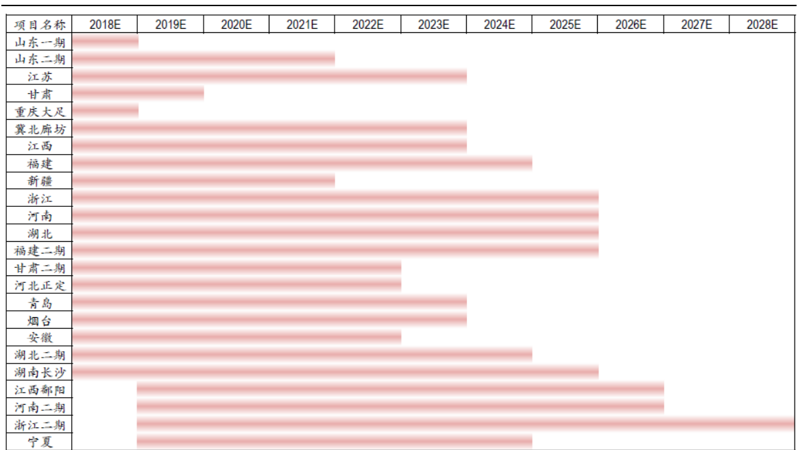
图表 2. 公司部分在手项目效益分享期示意图