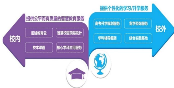
图1：立思辰教育业务布局

公司教育业务包括三大类：学习服务（中文未来）、升学服务（百年英才和跨学网）和智慧教育（康邦科技、敏特昭阳和立思辰合众）。