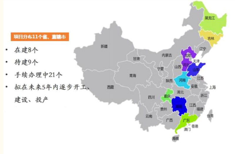
图表 1：公司环保新能源项目建设情况