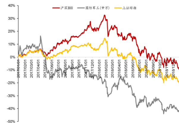
图 1： 2017 年初至今板块市场表现

截止 2018 年 12 月 28 日，2018 年上证综指下跌 24.59%，沪深 300 下跌 25.31%，军工板块累计下跌 31.04%。2017 年初至今，军工板块累计下跌 42.52%。本周军工板块累计下跌 0.46%，涨幅居 28 个子板块中第 7。